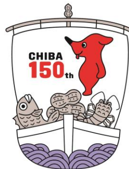
「千葉県 PR マスコットキャラクター チーバくん」

千葉県の誇る伝統郷土料理「太巻き祭りずし」は、切り口の文様の美しさに加え、地域の食材を生かすことができ、作る楽しみ、食べる楽しみがあります。当研究会ではこのすばらしい技術を絶やさぬように努めておりその活動の一環として、今年度は小学生・中学生を対象にデザインの募集を実施します。食べてみたいな～と思う、すてきな太巻きずしのデザイン画が届くことをお待ちしております。